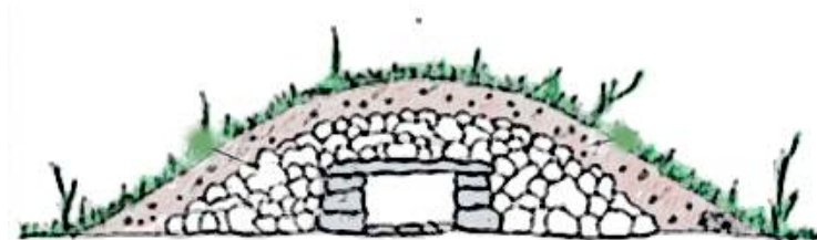
Snitt av en typisk gravhaug

Gravhaugene har trolig vært et viktig sentrum for dyrkelse i den førkristne forfedrekulten. Olav Geirstadalv var en konge i ynglingeætten som ble dyrket etter sin død. Det ble holdt blot ved gravhaugen hans til godt år og gravhaugene ble sett på som fruktbarhetsfremmende. Da Åsta Gudbrandsdatter skulle føde Olav Haraldsson, ble belte til Olav Geirstadalv – ifølge deler av sagalitteraturen om Hellig Olav – tatt ut av graven og brukt som magisk fødselshjelper.