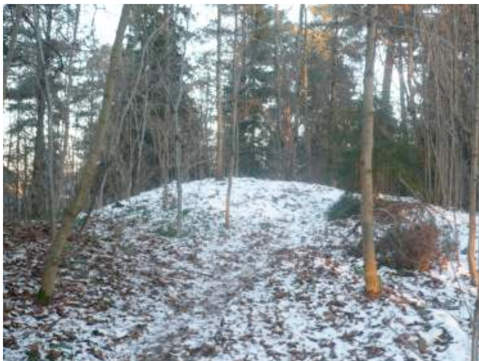
Gravrøysene på Kalvøya

kultur, men en kompleks verden med ulike dødsriter og trosformer som vi kan finne spor av i kildene til vår historie. Jeg har etter min mening gitt en grunnleggende oversikt, men det anbefales å lese mer av litteraturen i litteraturlisten for de som vil gå i dybden og lære mer om temaet siden det f.eks. finnes flere store gravplasser eller dødsriker man kan lese og lære mer om.